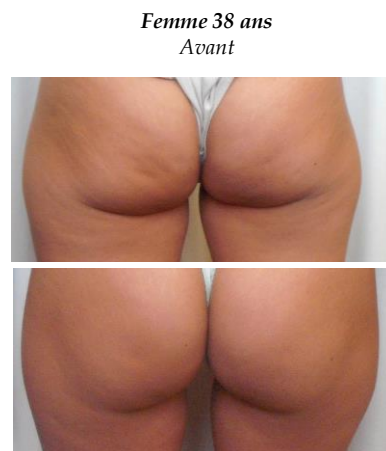
Après 12 séances