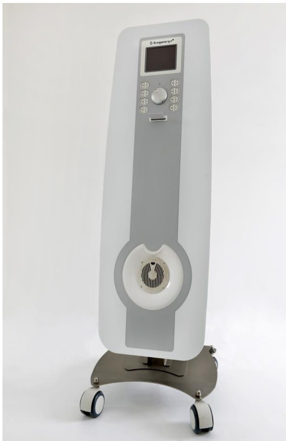
Le révolutionnaire Q-frequency e+®