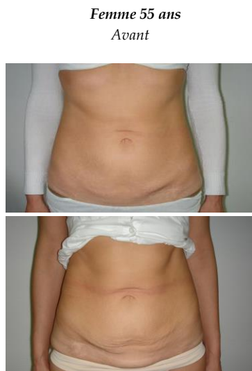
Après 12 séances

Dans le contexte actuel où l'avenir paraît anxiogène, la clientèle des centres esthétiques souhaite plus encore aujourd'hui ressentir une attention toute particulière et un service de qualité avec des résultats concrets.