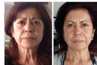
Femme 55 ans Après 10 Séances